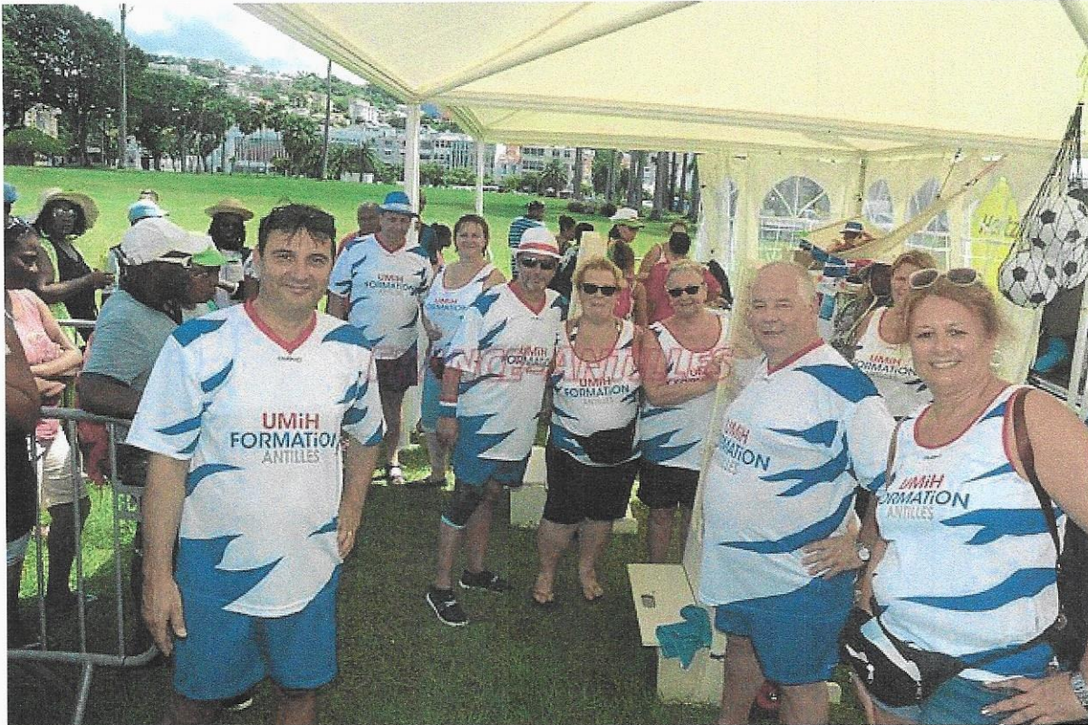
UMIH Formation n'est plus partenaire d'une yole, mais est bien présente sur le Village du Tour.

AUTOUR DU TOUR. L'UMIH Formation fait son e 4 Tour. « On est toujours là. Dynamique et très heureux d'être ici, en Martinique », confie le responsable de l'équipe. En 2014, ce Centre de Formation Professionnelle débute dans le Tour de Martinique des yoles rondes en sponsorisant, la yole du Robert « La Rose ». Un partenariat qui durera deux années successives. Cet organisme de formation a préféré sponsoriser cette « petite embarcation », plus souvent derrière que devant, plutôt que les Mapiipi. Dans le but d'aider logiquement et permettre à ses coursiers de participer aux compétitions dans de meilleures conditions. Les fiançailles n'ont duré que deux ans. La voile de l'UMIH n'est plus dans la flottille. En contrepartie, l'UMIH est resté fidèle au village du Tour. Et dimanche, il était, une fois de plus, parmi les chapiteaux les plus attrayants, remarquable par des longues files de joueurs. Ne vous fiez pas aux chiffres. Ce ne sont pas des prix mais le numéro des lots gagnés. Quoi de neuf cette année ? « Nous avons remplacé les jeux de roue par trois jeux du fakir. Il y a de très beaux lots à gagner : des hamacs, des barbecues, des nounours, des sacs isothermes. Nous avons fait un effort considérable pour satisfaire les Martiniquais. » Alors faites vos jeux dans les différentes communes d'accueil!